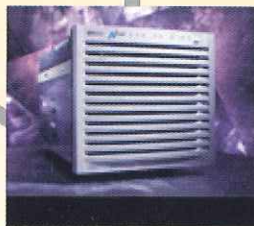
HP 9000 N4000 Enterprise Server